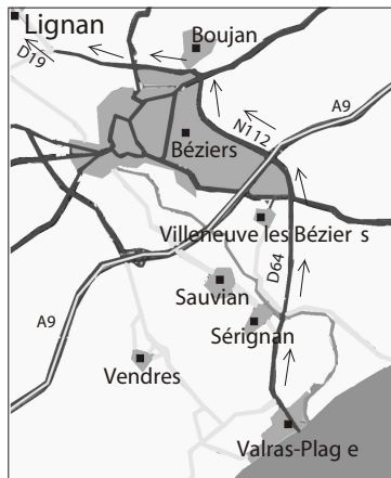
Contournement de Béziers par la rocade.

15,5 km | Surnommé le «Petit Nice», ce petit village bénéficie d'un climat exceptionnellement doux. Autour de l'église du XVIIème siècle et de la vieille tour moyenâgeuse en ruines fleurissent mimosas et orangers. A découvrir : Le Jardin Méditerranéen. Ouvert du 15/02 au 30/06 et du 01/09 au 15/11 de 9 H à 12 H et de 13 H 30 à 17 H. Ouvert du 01/07 au 31/08 de 9 H à 19 H. Durée de la visite : 45 mn.